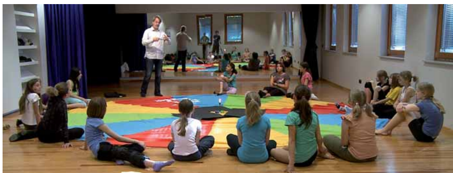
Lernen ohne Tisch und Stuhl im „Otium“