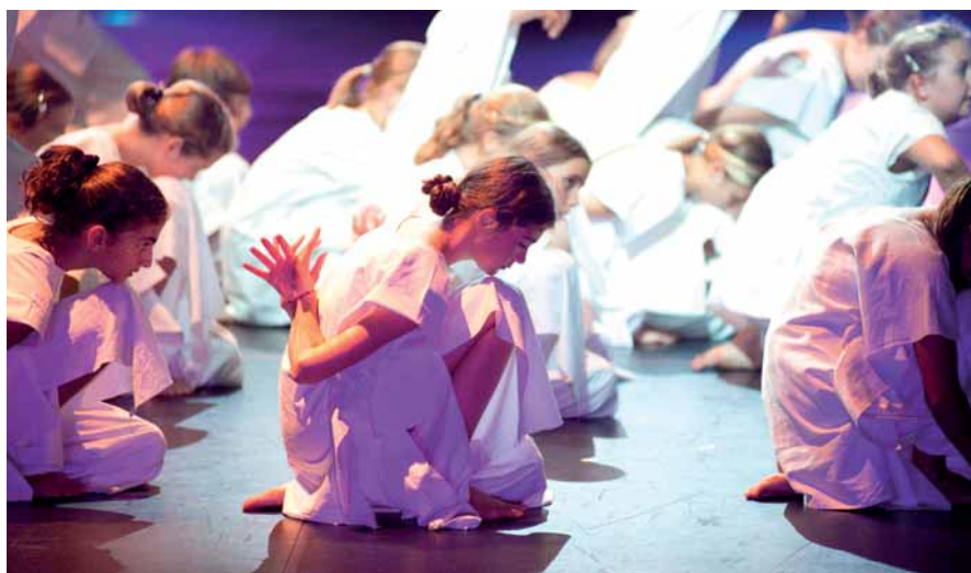
Community Dance Minden, Verdi Requiem 2010