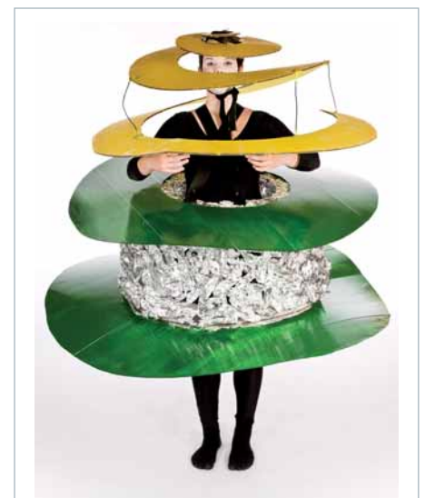
Den Durchblick wagen! Figuren zum Triadischen Ballett von Oskar Schlemmer

Tanz: Tanzarbeitsgemeinschaft für alle Stufen; Tanzprojekt Ratsgymnasium; Community Dance Minden; Zusammenarbeit mit Choreographen und Tänzern; Tanz im Sportunterricht in der Sekundarstufe I.