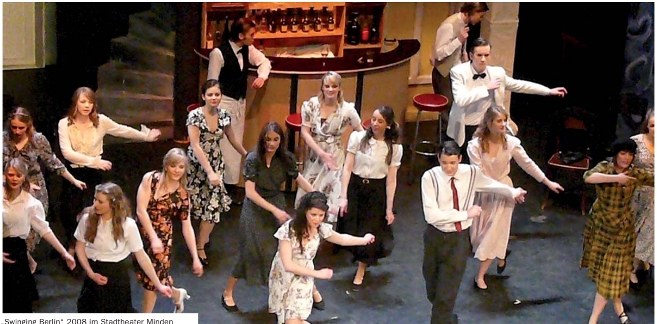
„Swinging Berlin“ 2008 im Stadtheater Minden