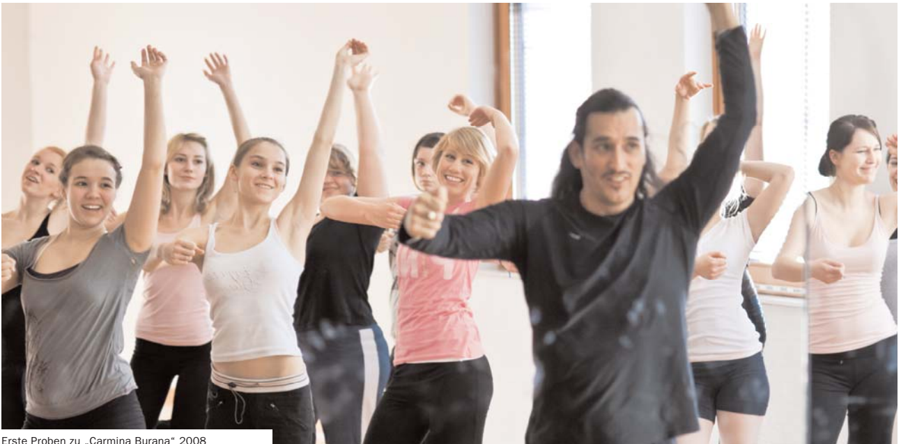
Erste Proben zu „Carmina Burana“ 2008