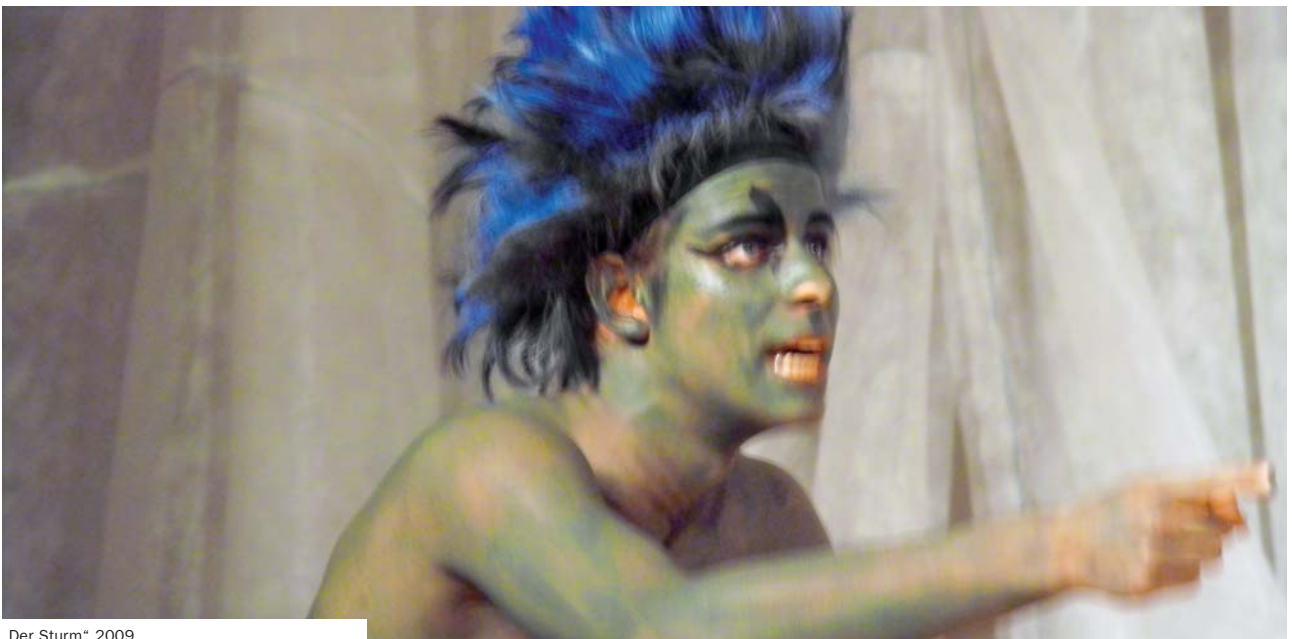
„Der Sturm“ 2009