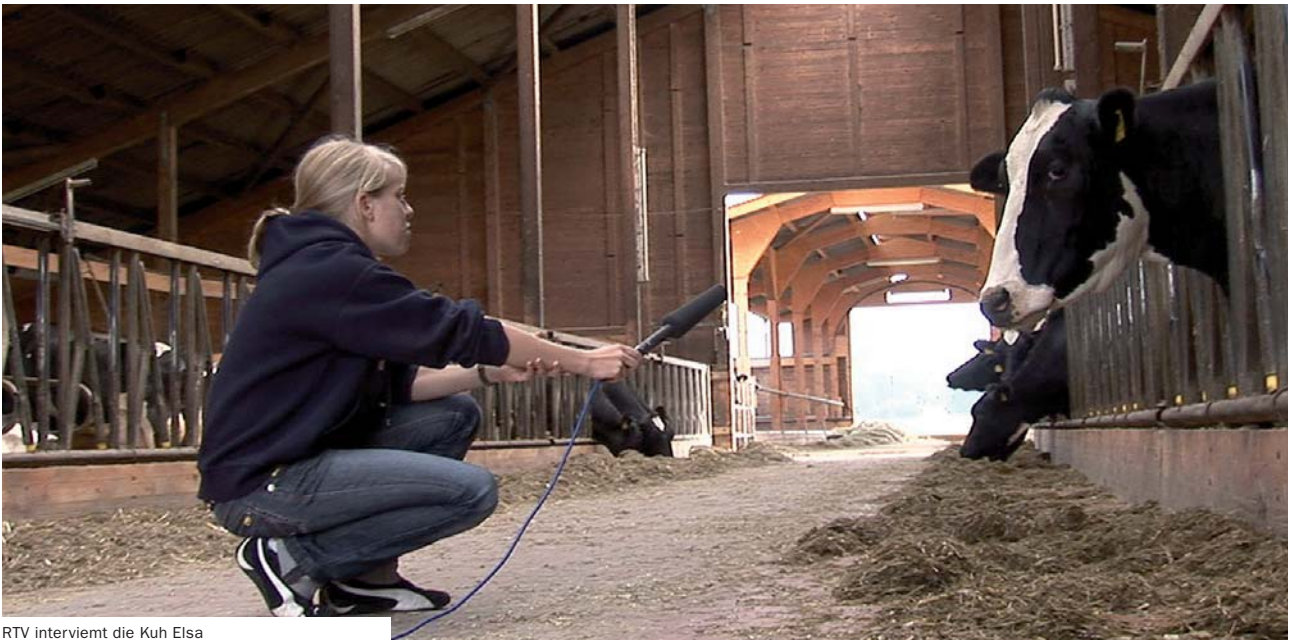
RTV interviewt die Kuh Elsa