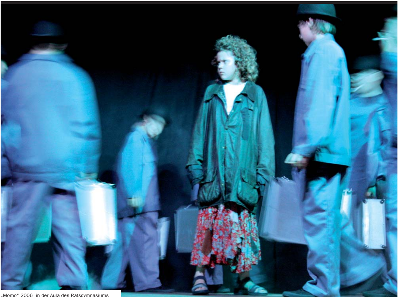
„Momo“ 2006 in der Aula des Ratsgymnasiums