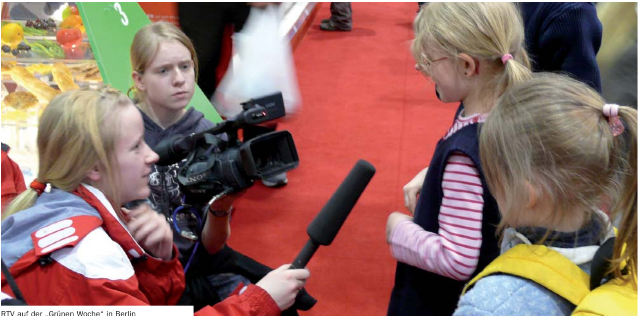
RTV auf der „Grünen Woche“ in Berlin