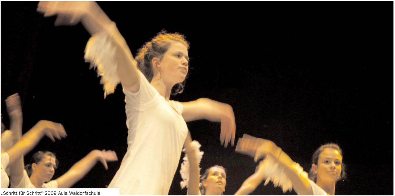
„Schritt für Schritt“ 2009 Aula Waldorfschule