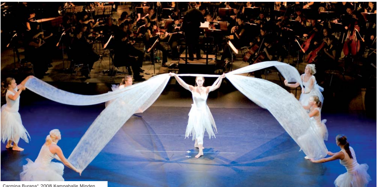
„Carmina Burana“ 2008 Kampahalle Minden